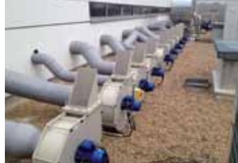
Ventilateur centrifuge de laboratoire