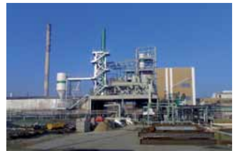
CHIMIE FINE ET LOURDE