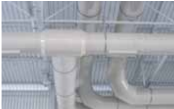
Tubes & Coudes