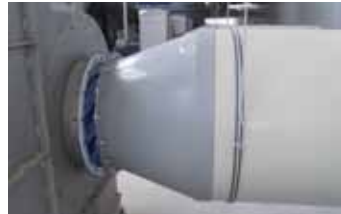
Brides & Raccords