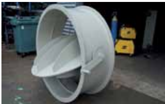
Vannes & Registres