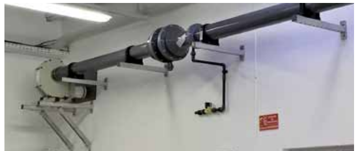
DIVERS INDUSTRIES : TANNERIES, ETC.

Les procédés industriels génèrent des pollutions variées : notre métier est d'optimiser la ventilation , conformément à vos exigences et celles de la réglementation en vigueur.