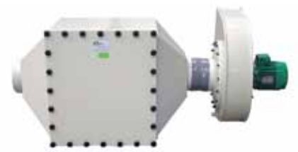
Caisson à charbon actif