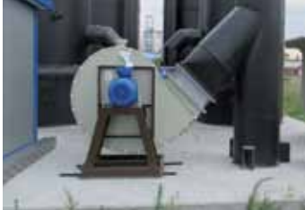
Ventilateur centrifuge moyenne/haute pression