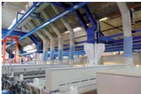
TRAITEMENT DE SURFACE