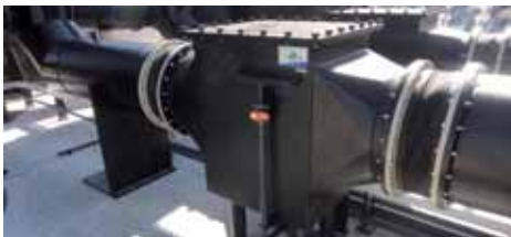
Séparateurs de gouttes