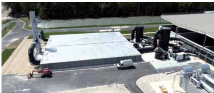
TRAITEMENT DE DÉCHETS & COMPOSTAGE